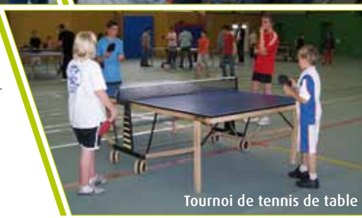
Tournoi de tennis de table