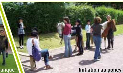
Initiation au poney