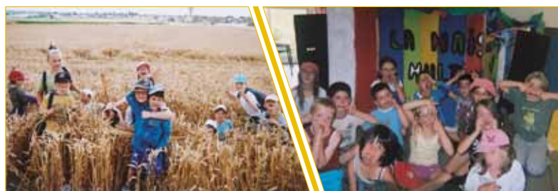
Enfants des camps en ballade dans les champs

Tous sont devenus des inconditionnels d'A.G.L.A.E !