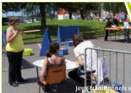
Jeux traditionnels en bois