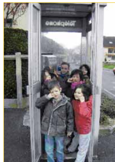
Grand jeu sur la ville (Pâques 2008)

Nombreux sont les bénévoles qui s'investissent durablement dans la gestion de l'association et perpétuent l'histoire de l'association.