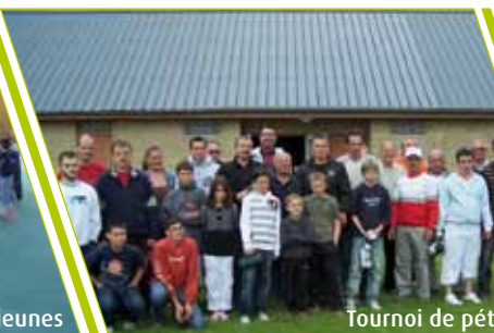
Tournoi de pétanque