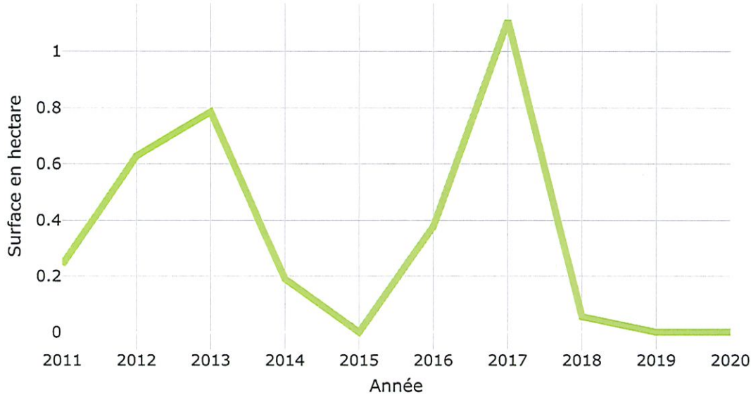
Surface foncière consommée entre 2011 et 2020 en hectare

3,39 hectares consommés entre 2011 et 2020 soit 0,339 par an 39,40 hectares de ZAC dont 0,00 comptabilisé dans CCF