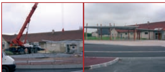
Rue Pasteur - Première phase