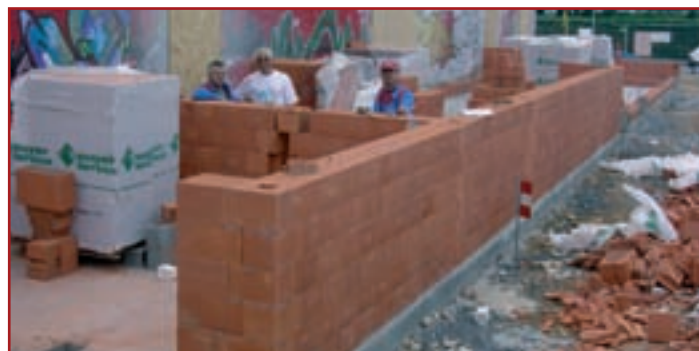
Salle M. Baquet - extension vestiaires - après