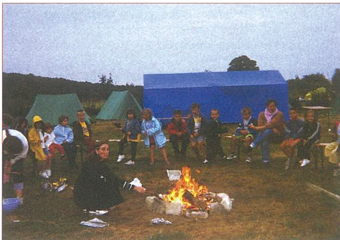
« Traditionnelle veillée au feu de bois » Juillet 2003