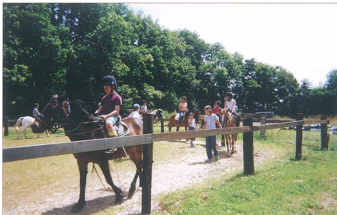
« Les grands à l'équitation » La Grange d'Espins Été 2003