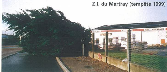
Z.I. du Martray (tempête 1999)

O n parle de tempête pour des vents moyens supérieurs à 89 km/h. Ces perturbations atmosphériques sont plus fréquentes à l'automne/hiver qu'au printemps et l'été. Les vents sont d'autant plus violents que la chute de pression entre l'anticyclone et la dépression est importante, provoquant ainsi de fortes précipitations de pluies.