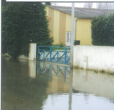
Remontée des nappes phréatiques ZI du Martray en 2001.

• Une montée en charge rapide et importante des eaux de la "Gronde" (une partie des eaux pluviales de CUVERVILLE et de DEMOUVILLE se jetant dans ce ruisseau d'ordinaire à sec) Néanmoins, les secteurs les plus sensibles correspondent aux points les plus bas, notamment à l'endroit du passage sous voirie rue du Centre.