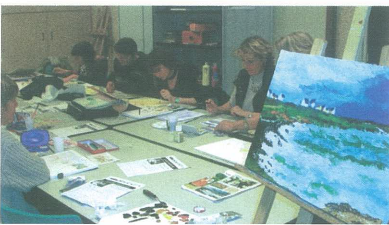
Atelier aquarelle et huile