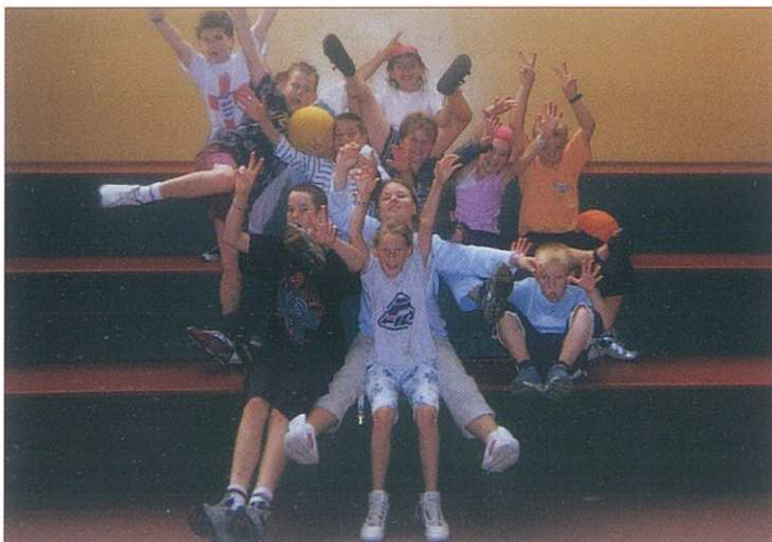
Le groupe des grands au gymnase Juillet 2003

Le séjour sera organisé sous tente sur le point accueil jeunes de Asnelles.