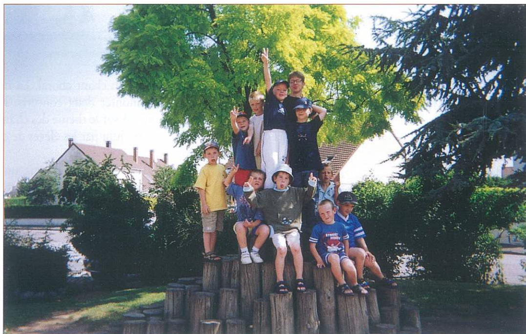
Le groupe des moyens en sortie Été 2003

Les inscriptions pour la nouvelle rentrée scolaire se feront au Centre de Loisirs à partir du lundi 23 août.