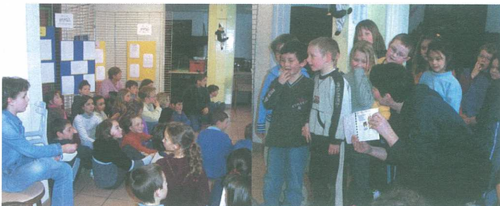
Remise des prix du concours poésie catégorie « classes »